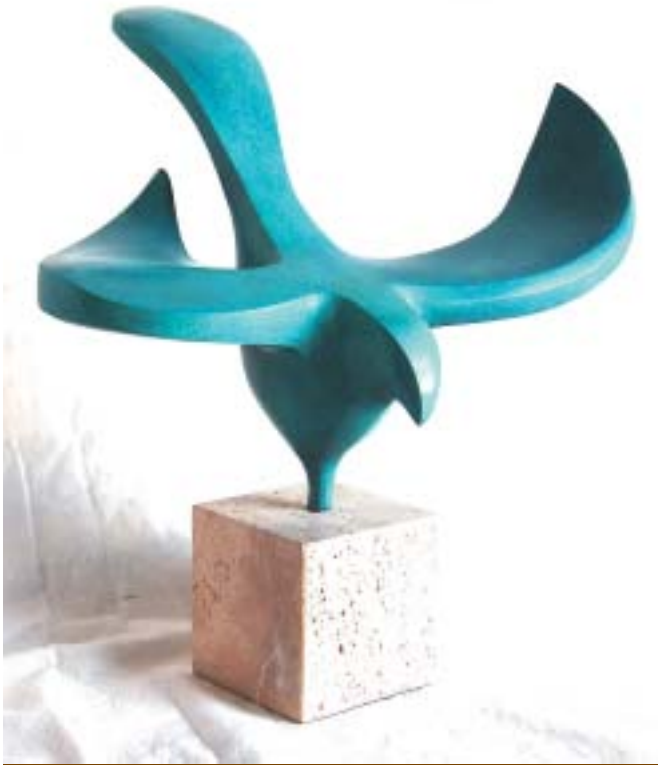
Nº 15: "Paloma". 2008. Bronce sobre mármol. 27,5 x 37,5 x 29,5 cm.