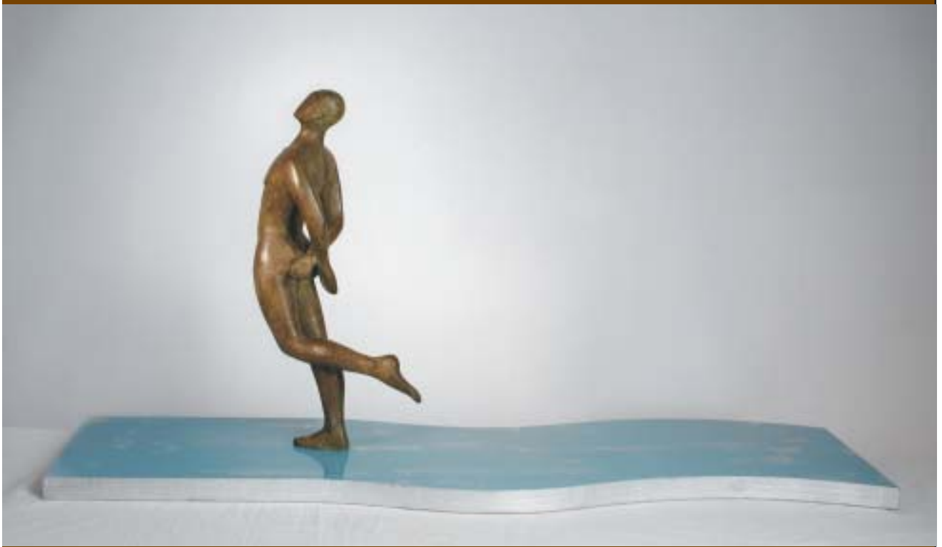
Nº 9: "El patinador". 1997. Bronce, metacrialto, madera y poliéster. 42,5 x 90 x 29 cm.