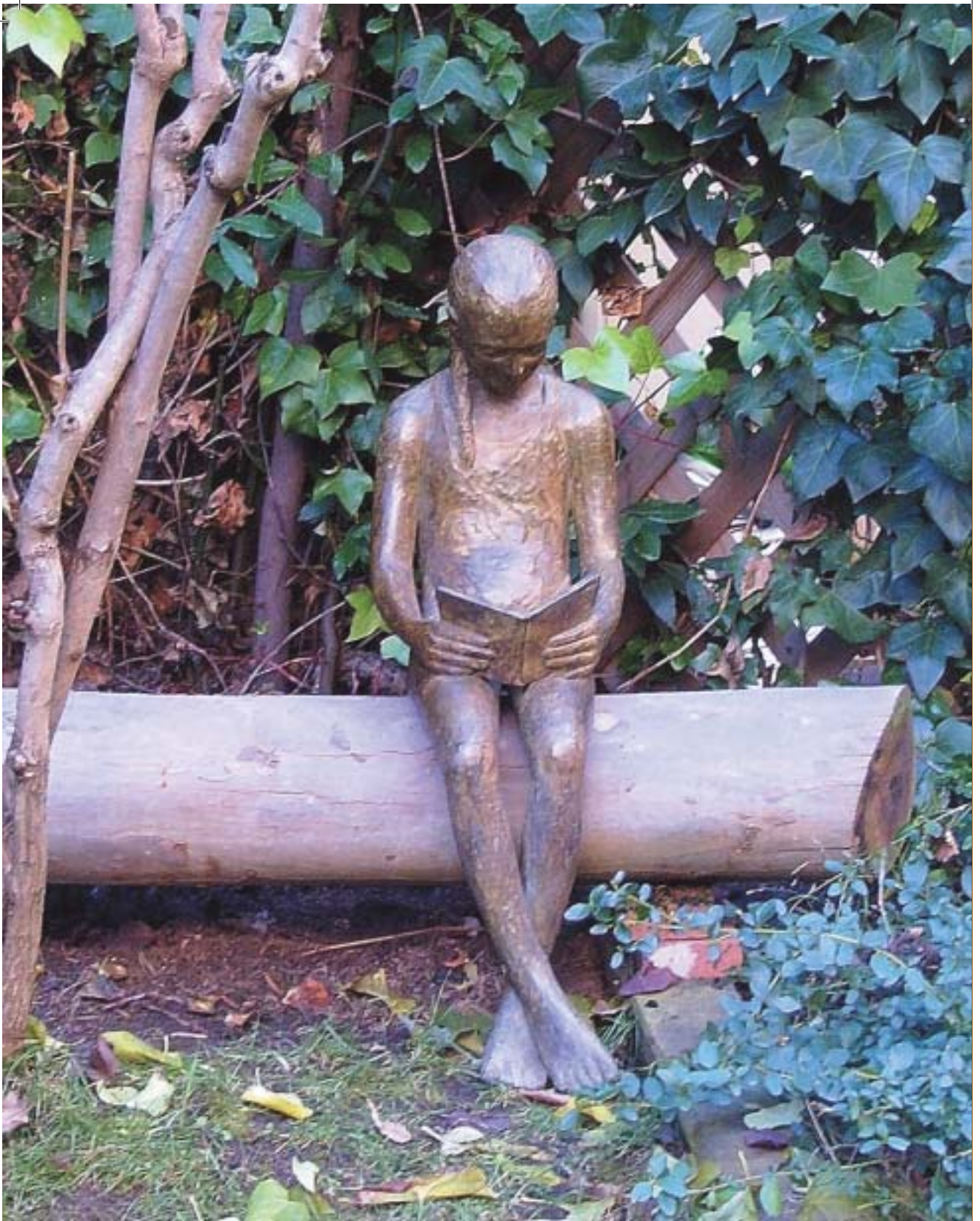
Nº 13: "El cuento". 1992. Bronce. 87 x 30 x 60 cm.