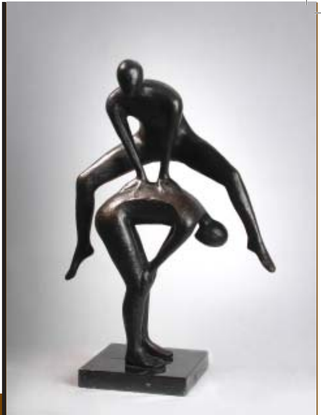
Nº 12: "Correcalles". 1992. Bronce sobre mármol . 54 x 39 x 23 cm.