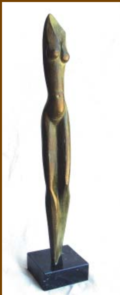
Nº 10: "Un paso elegante". 2005. Bronce sobre mármol. 50 x 5,5 x 6 cm.