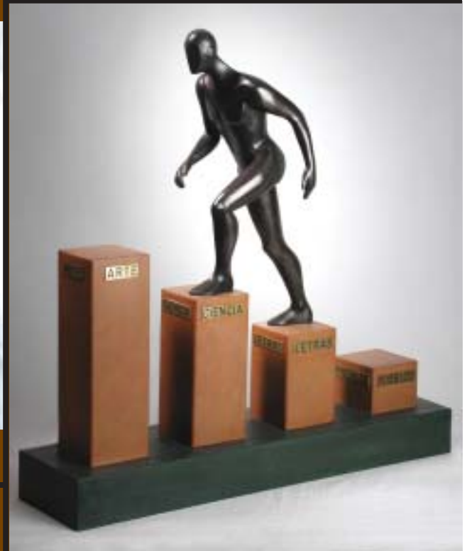
Nº 4: "El hombre avanza en la cultura". 1994. Bronce, acero y latón. 56 x 56,5 x 14 cm.