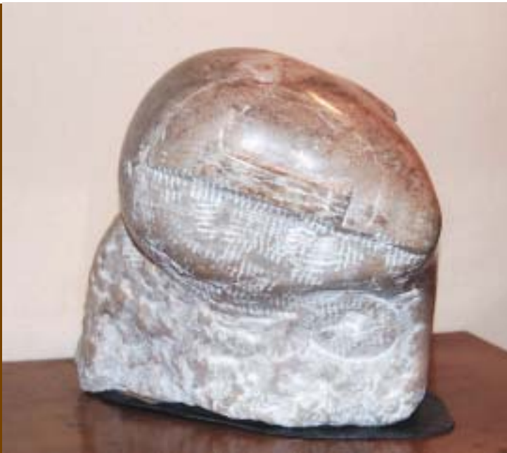
Nº 17 : "Nostalgia". 1990. Alabastro. 30 x 34 x 25 cm.