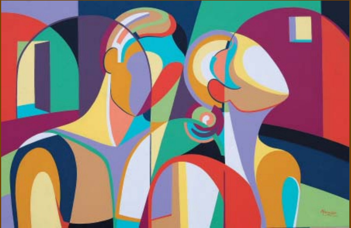
Nº 1: "Tan cerca, tan lejos". 2009. Acrílico sobre tabla. 61 x 94 cm.

Ana Hernando crea, a través de los materiales aptos para la escultura, formas llenas de estilo muy personal, con planos que marcan en las piezas la evolución a lo largo de los numerosos años que lleva trabajando.