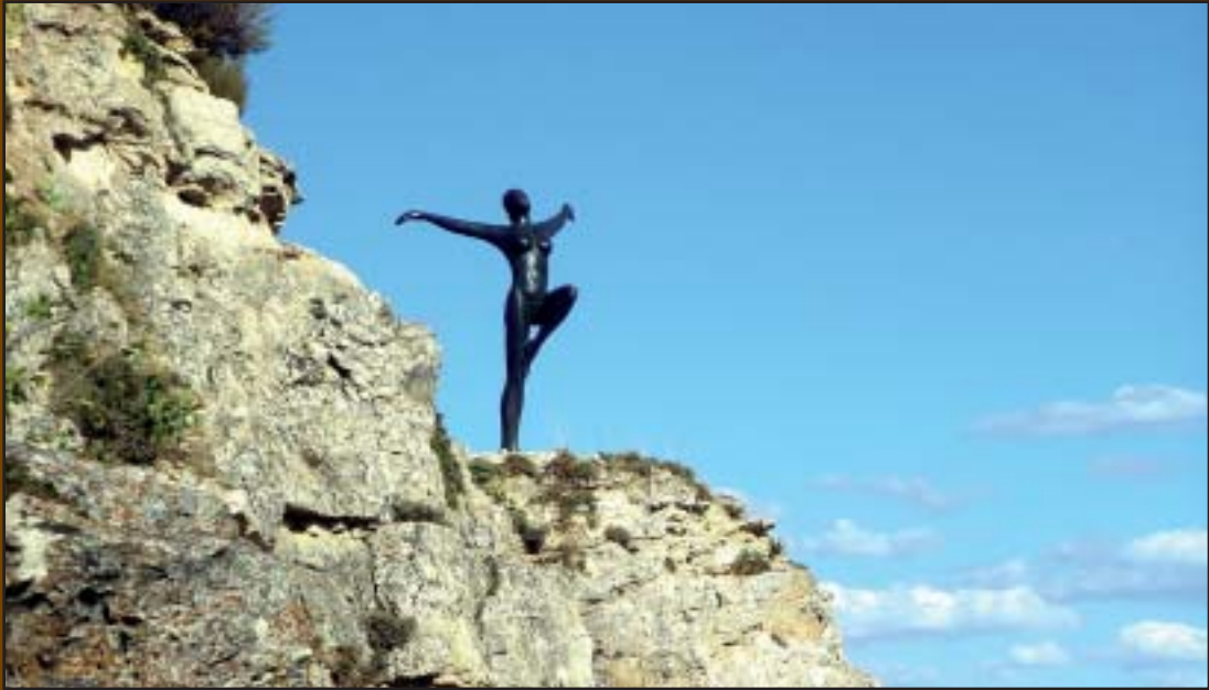
Nº 30: "AIRE DE VIDA" . 2008. Bronce. 2,40 m de altura. Proyecto Hitos del Rodenal. Luzón (Guadalajara).