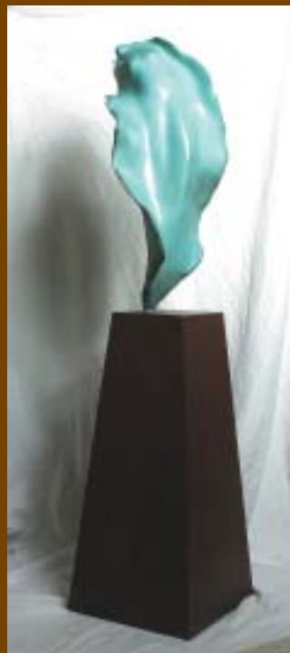
Nº 11: "Acuática". 1993. Bronce sobre acero. 144 x 35 x 35 cm.