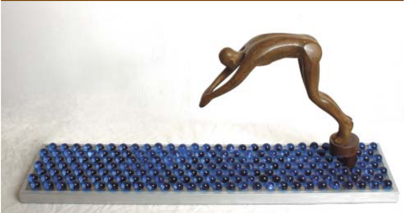
Nº 3: "El hombre y el mar". 1997. Bronce, acero, madera, cristal y aluminio. 37 x 81,5 x 19,2 cm.