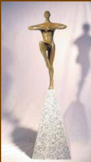
Nº 7: "Distancia de un sentimiento". 1997. Bronce y granito. 86,5 x 23 x 23 cm.