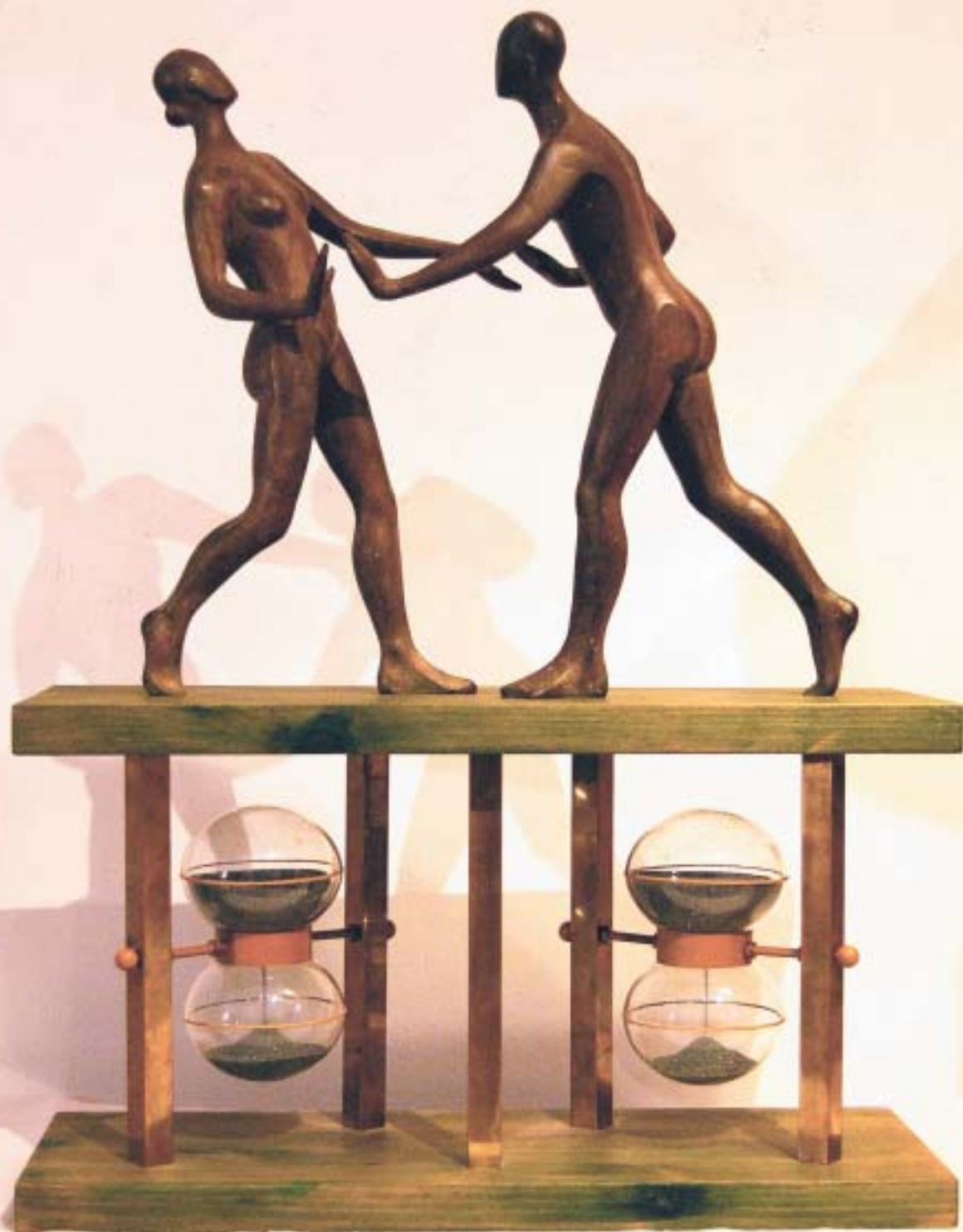
Nº 6: "Acción-reacción: Instante de la Humanidad". 1996. Bronce, madera, latón, metacrílico y carborundo. 72 x 55 x 20 cm.