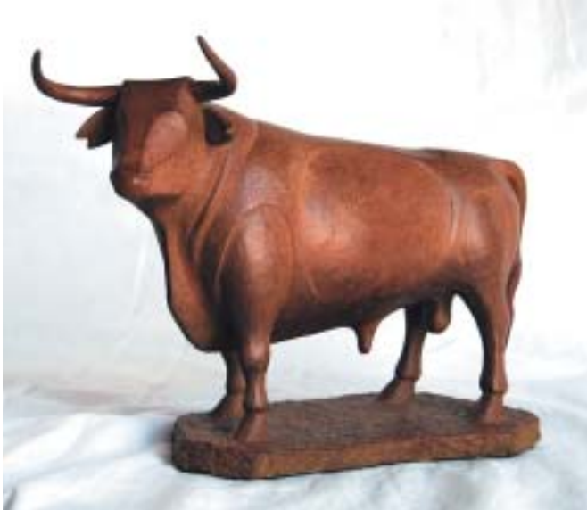
Nº 14: "Bravo bello". 2008. Bronce. 22,5 x 29,5 x 12,5 cm.