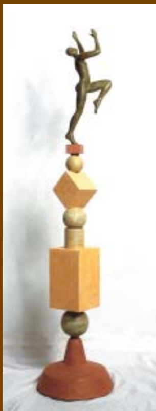
Nº 2: "Salto de alegría". 1997. Bronce, madera, acero, chapa y cemento. 155 x 33 x 33 cm.