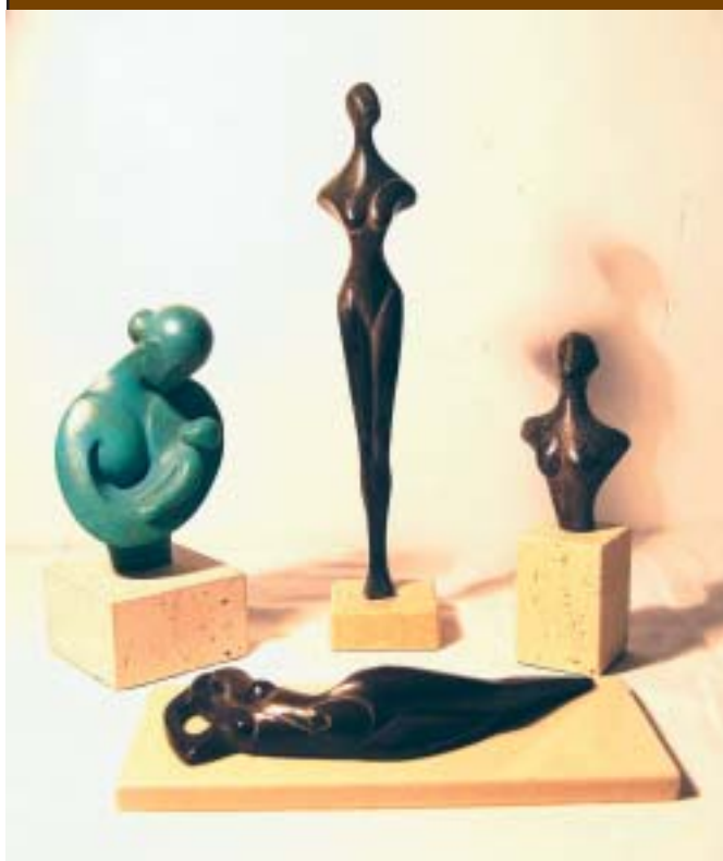
Nº 29: "Abrazo". 1993. Bronce sobre mármol. 13,5 x 6,5 x 6,5 cm.