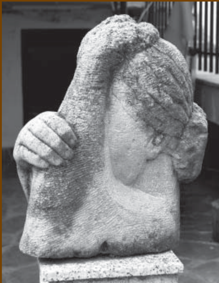
Nº 18 : "Preocupación". 1991. Arenisca. 52 x 25 x 46 cm.